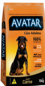
RAÇÃO PARA CACHORRO AVATAR 15KG