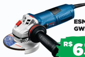
ESMERILHADEIRA GWS 5POL BOSCH