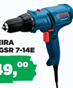
FURADEIRA BOSCH GSR 7-14E