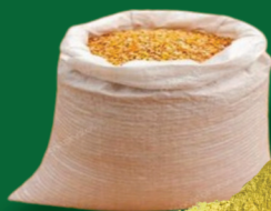
MILHO EM GRÃO 50KG