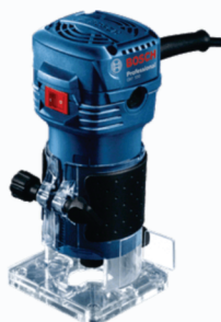
TUPIA MAKITA BOSCH M3700B