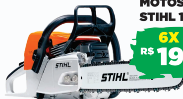
MOTOSERRA STIHL 170