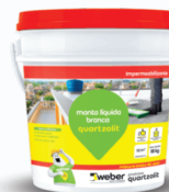
MANTA LÍQUIDA TELHA QUARTZOLIT 18KG