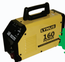
INVERSOR LYNUS 160 POWER