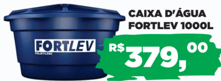
CAIXA D'ÁGUA FORTLEV 1000L