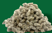
CAROÇO DE ALGODÃO 30KG