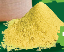
MILHO MOÍDO 50KG