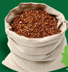
SORGO EM GRÃO 50KG