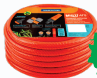
MANGUEIRA JARDIM TRAMONTINA 1/2 LARANJA