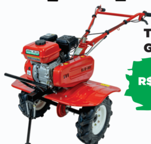
TRATOR 6.5HP GARTHENR