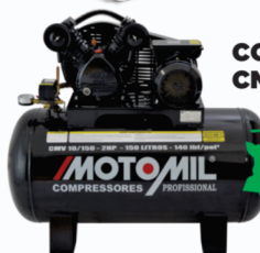
COMPRESSOR MOTOMIL CMV 10/100 2HP 100L