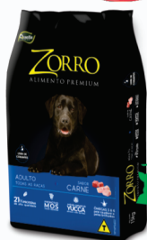
RAÇÃO PARA CACHORRO ZORRO 25KG