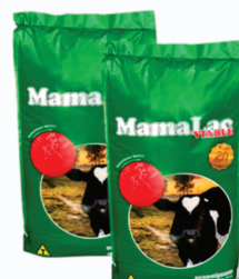
LEITE EM PÓ P/ BEZERROS MAMALAC 10KG