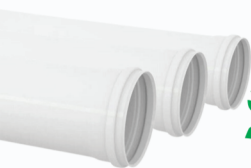
TUBO ESGOTO 100MM KRONA