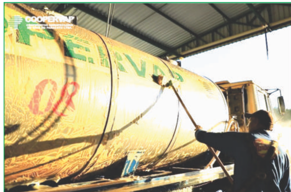
Novo lavador de caminhões: Moderno e sustentável, projetado para cumprir as normas ambientais representando um avanço na estrutura de atendimento aos transportadores e produtores.

Entre as realizações mais recentes, a Coopervap inaugurou um lavador de caminhões moderno e sustentável, com capacidade para atender até sete veículos simultaneamente. Projetado