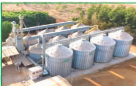
Expansão dos silos de grãos e instalação de uma nova balança na unidade do Entre Ribeiros: mais controle e eficiência.

A marca Paracatu é um orgulho para a Coopervap e para seus associados. A manteiga e os queijos da linha, que conquistaram prêmios e reconhecimento nacional, são exemplos do compromisso com a qualidade. Em busca de fortalecer ainda mais sua presença, a Coopervap investe na ampliação da produção do laticínio e no desenvolvimento de novos produtos, sempre priorizando o sabor e a excelência que caracterizam a marca.