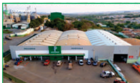
Sob a gestão atual, a Coopervap alcança novos horizontes e se destacando pela execução de ações e obras que impactam diretamente a vida dos seus associados e da comunidade em geral.

Para atender à crescente demanda, a Coopervap modernizou seu parque industrial, incluindo a instalação de uma nova fábrica de ração que triplicará a capacidade produtiva com menor consumo de energia. Na unidade Entre Ribeiros, a expansão dos silos de grãos e a instalação de uma balança de alta tecnologia proporcionam mais controle e eficiência. Além disso, o hipermercado Coopervap mantém o único açougue na cidade com certificação de inspeção sanitária, reafirmando as boas práticas de qualidade e higiene que são padrão na cooperativa.