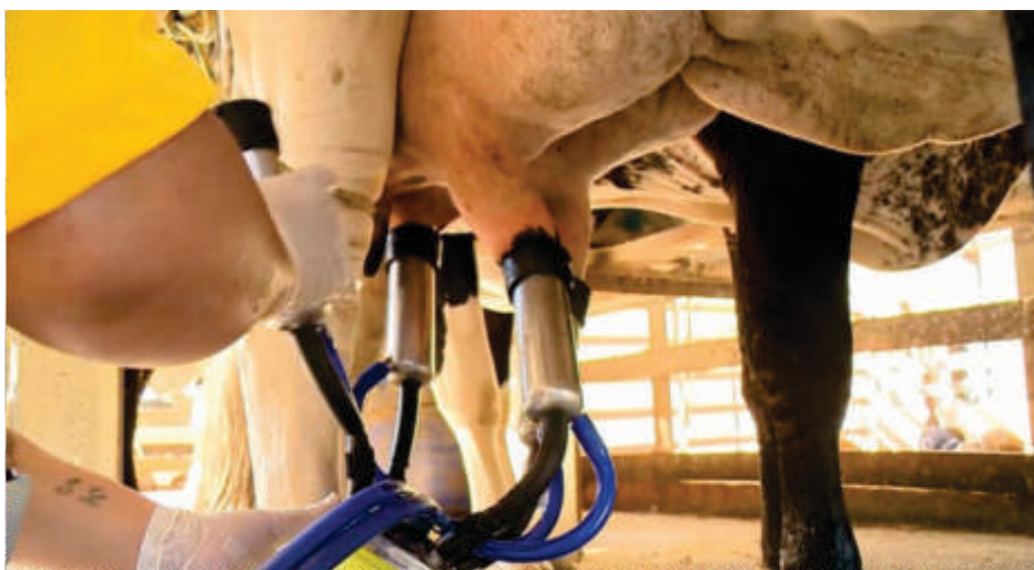
Produzir leite com qualidade começa com cuidados diários e atenção aos detalhes.

No próximo mês, abordaremos outro tema fundamental para a qualidade do leite: a Contagem de Células Somáticas. Vamos explorar como você, cooperado, pode atuar para melhorar ainda mais os índices de sanidade do rebanho e elevar o padrão do leite da nossa cooperativa.