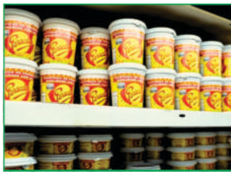
Marca Paracatu: Orgulho da Coopervap e seus associados

A Coopervap segue em ritmo de crescimento e inovação, reafirmando seu papel fundamental no desenvolvimento de Paracatu e região. Sob a gestão atual, a cooperativa alcança novos horizontes e se destaca pela execução de ações e obras que impactam diretamente a vida de seus associados e da comunidade. Investindo em qualidade, infraestrutura e compromisso social, a Coopervap consolida sua posição como referência no setor agroindustrial.