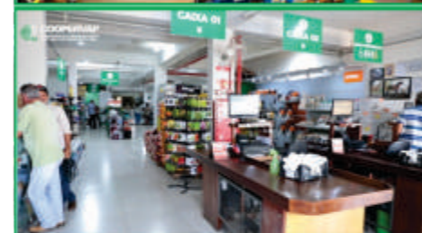
Ampliação das lojas veterinárias e aumento no número de agrônomos disponíveis para prestação de serviços de assistência técnica.