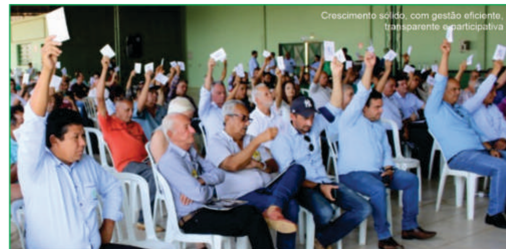
Crescimento sólido, com gestão eficiente, transparente e participativa

em sua missão de promover a sustentabilidade, apoiar a comunidade e garantir o crescimento para todos os associados.