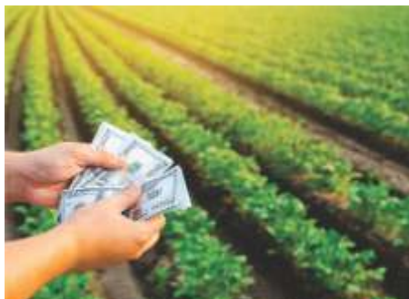
Com a nova medida da Receita Federal, setores como comércio varejista, automotivo, construção civil e, especialmente, o agronegócio, enfrentam um possível aumento da carga tributária.

empresas que adquirem os produtos, elevando seus custos operacionais.