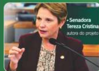
- Senadora Tereza Cristina, autora do projeto