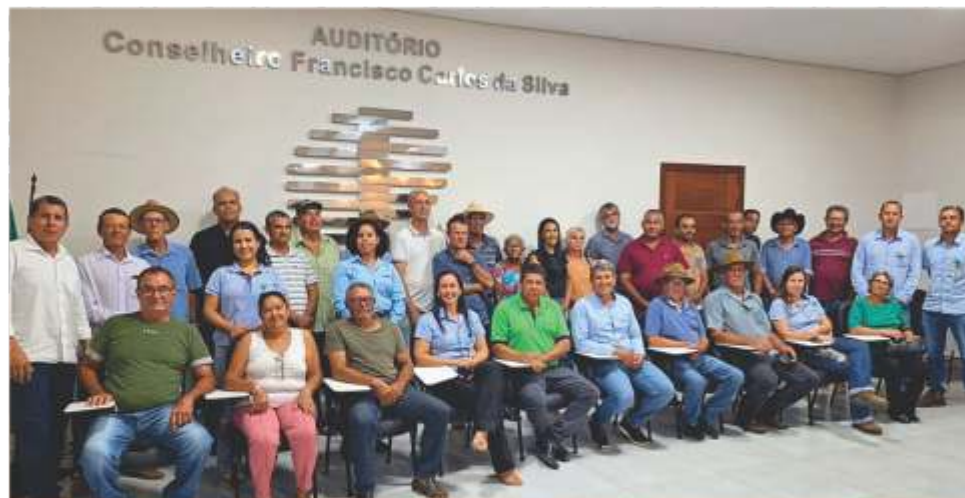
União que gera resultados: Cooperados reunidos no Auditório Conselheiro Francisco Carlos da Silva durante a apresentação do balanço positivo de 2025.